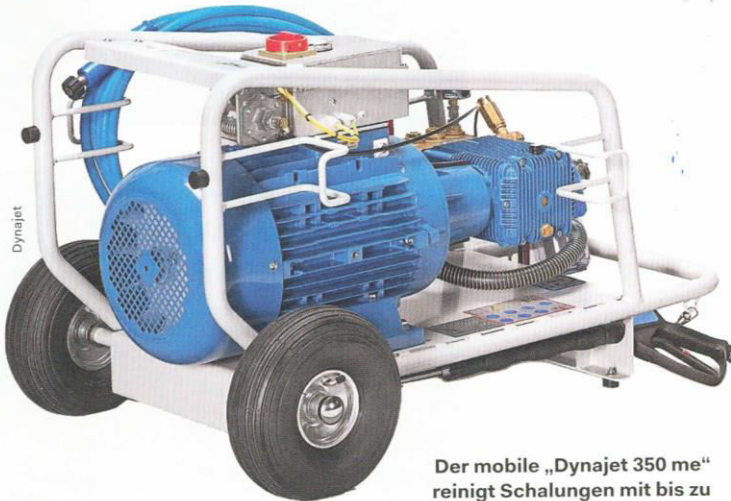
Der mobile „Dynajet 350 me“ reinigt Schalungen mit bis zu 350 Bar Arbeitsdruck und steigert die Effizienz am Bau.

Dynajet ermöglicht mit seinen Reinigungsgeräten die flexiblere und raschere Wiederverwendung von Schalungen am Bau.